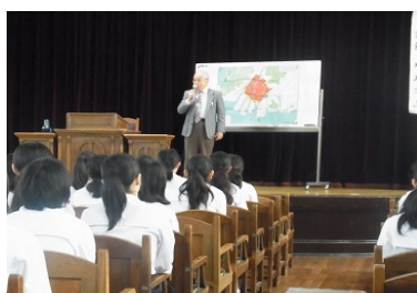
川本さんの講演の様子