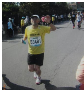
ゴール寸前、フワフワしながら走っているところです。